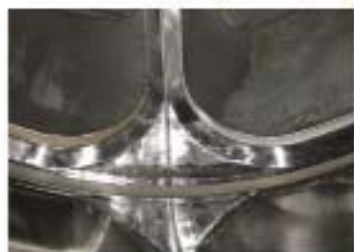
Стенка, разделяющая фильтры