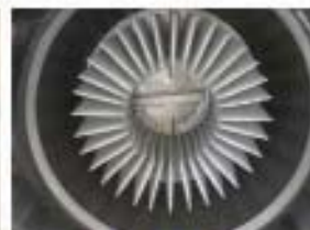
Вид снизу на смонтированные фильтры

32 отдельных рукавных фильтра Непрерывная очистка при грануляции Непрерывная работа распылительной форсунки Не происходит блокировки или разрыва фильтров