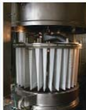
Демонтированная система фильтров SEPAJET