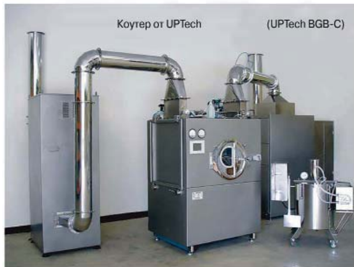
Кougrep от UPTech

В проектах используется оборудование известных китайских производителей.