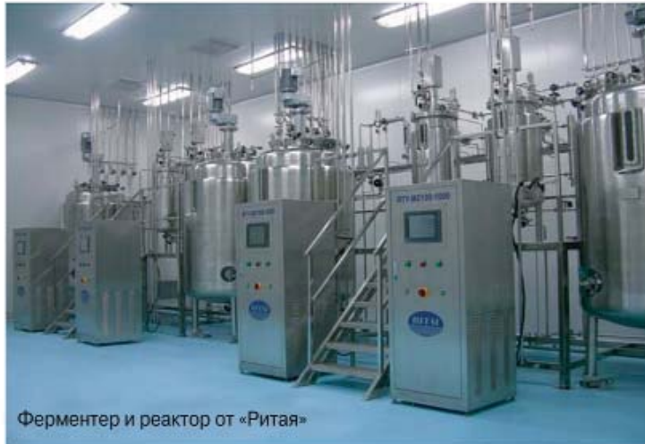
Ферментер и реактор от «Ритая»